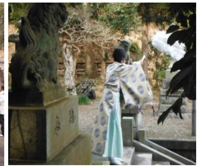
豊間地区に向かったのお祓い