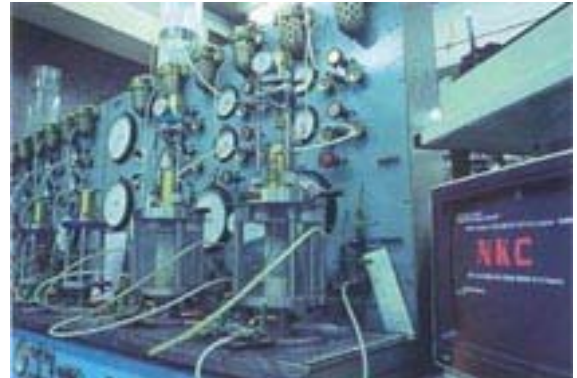
コンピューターを使用した室内試験