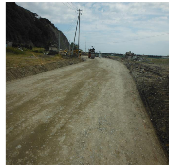
アスファルト舗装を待つ仮設道路

道路幅員は確保していますが、工事に影響が少なくなる場所に仮設道路を設置しています。道路に曲がり等ありますので、スピードを出さずにゆっくり安全に通行してください。迂回路への切回しは11月から行います。よろしくお願いいたします。