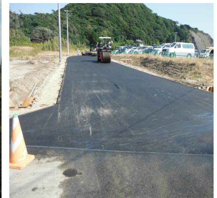
アスファルト舗装施工中