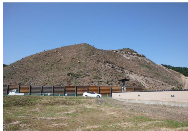
伐採が進んで樹木が無くなった山(南高台)