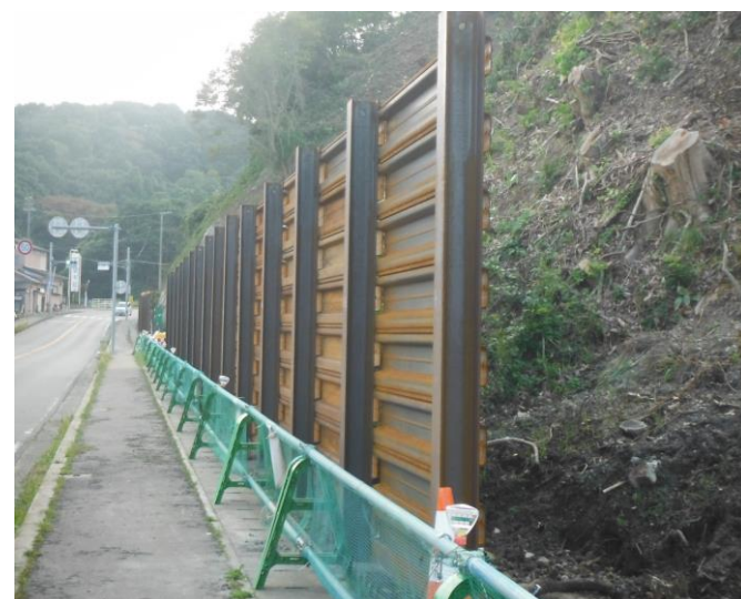
歩道脇に並んだ落石防護柵