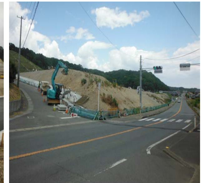
落石防護柵を取り除いた南高台 (手前は県道小名浜四倉線)