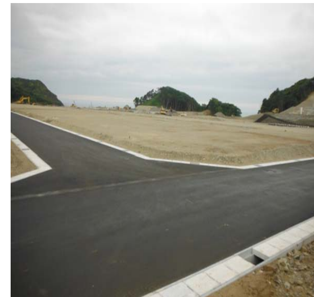
北高台から海側の宅地を見た風景

その後道路排水工事や宅盤整地工事を行い、今回の引渡しを行う準備が出来ました。満足出来る宅地が出来上がったと思います。