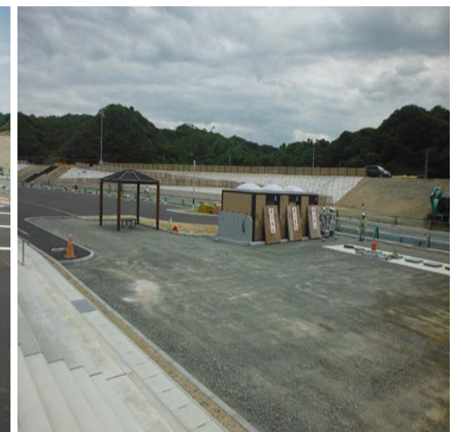
トイレ及び東屋付近