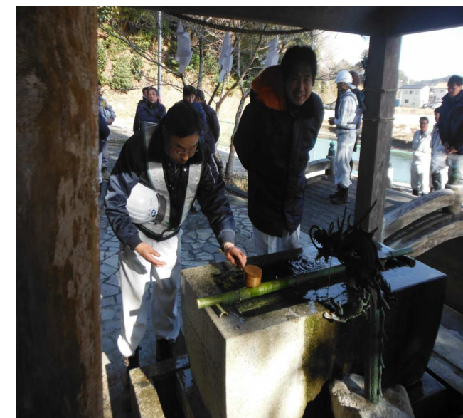
順番に参拝前の手水

参加予定者が全員そろったところで参道に3列に並び、最上所長を先頭に2礼2拍1礼のお参りを行いました。工事の安全は基より、工事完了後の引渡しを笑顔で行えるように祈念して、今年の現場初詣が無事に終わりました。