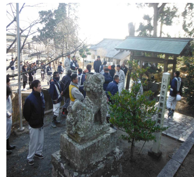
手水を終えて参拝を待つ参加者

今年で工事が完成となりますので、最後まで無事故・無災害で工事が終わることを祈念するために、JV職員と1次下請けの職長さんが参列しました。午前10時の集合前に集まった人から手水をしてお参りの準備をしておきます。参加予定者が全員そろったところで参道に3列に並び、最上所長を先頭にして2礼2拍1礼のお参りを行いました。工事の安全は基より、工事完了後の引渡しを笑顔で行えるように祈念して、今年の現場初詣が無事に終わりました。