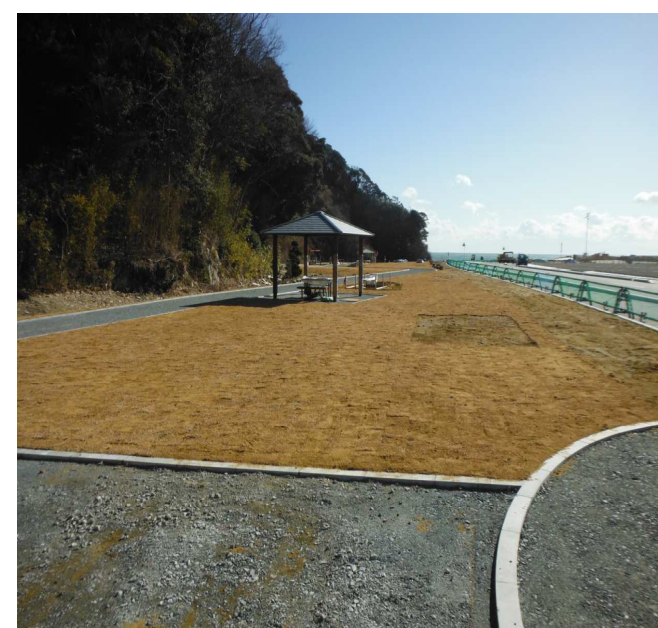
北側から見た1号公園

公園の南端には安波神社がありますので、神社へお参りの時には1号公園で気分転換を試みてはいかがでしょうか？