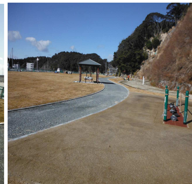
南側から見た1号公園