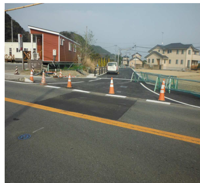
県道から見た6-24号線