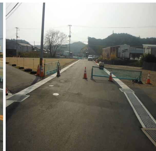
二股から見た6-24号線